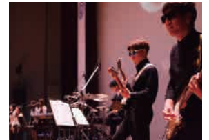
앙상블 클래스 공연