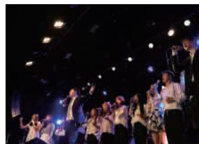
서울 삼익 MPOT홀 초청공연